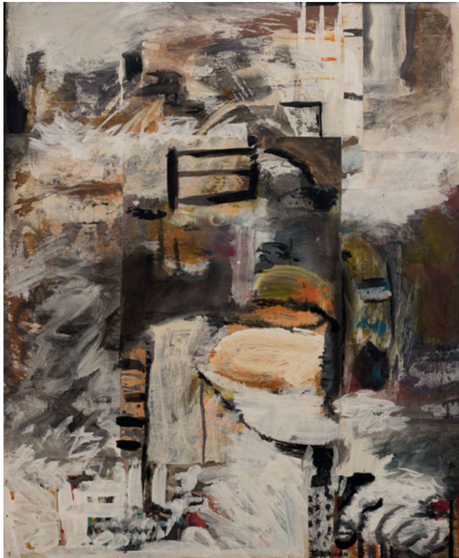
Otra ciudad, Bruselas 1996 Collage y acrílico/lienzo 73 x 60 cm