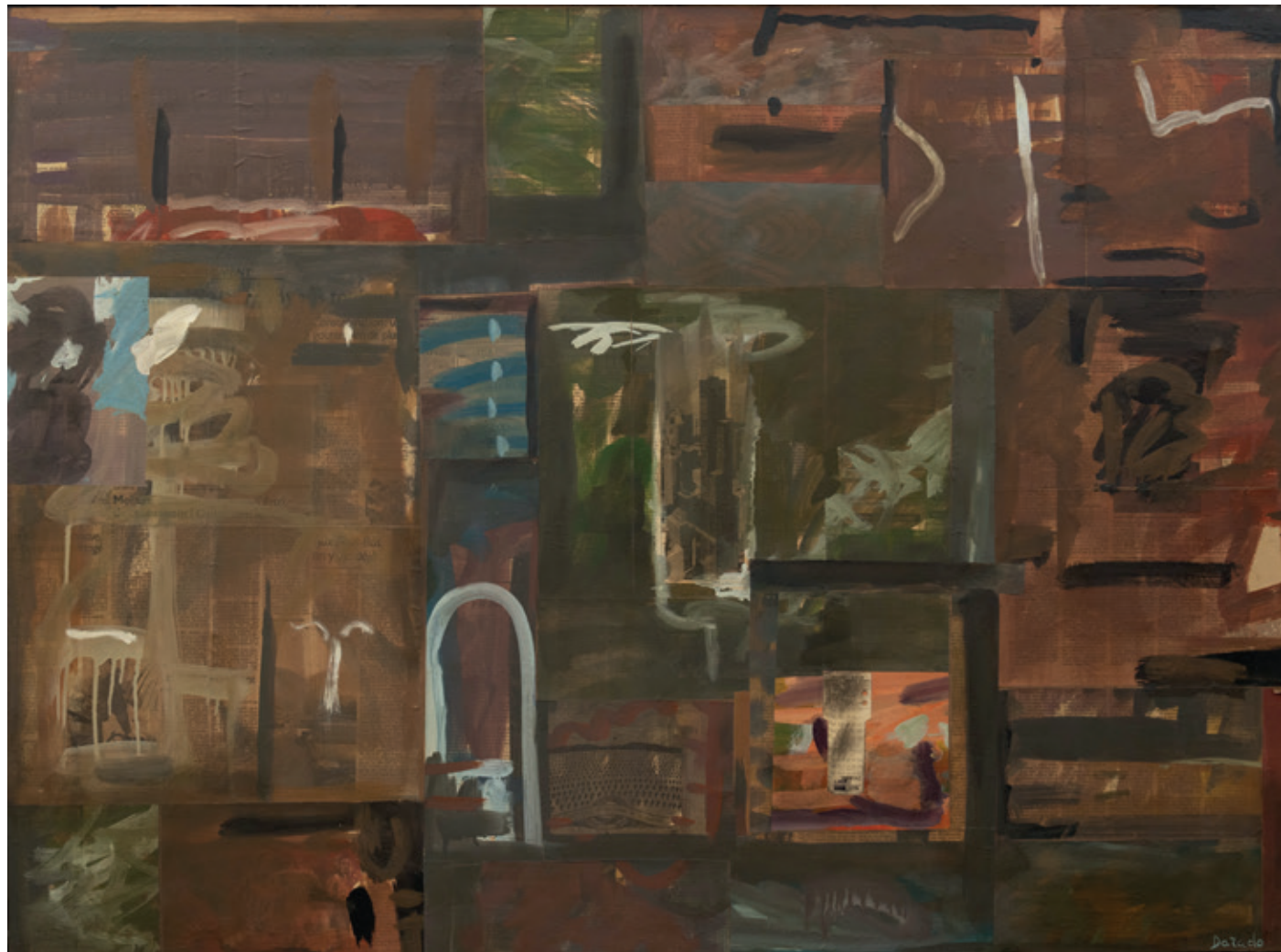
El billete , Bruselas 1992 Collage y acrílico/lienzo 97 x 130 cm