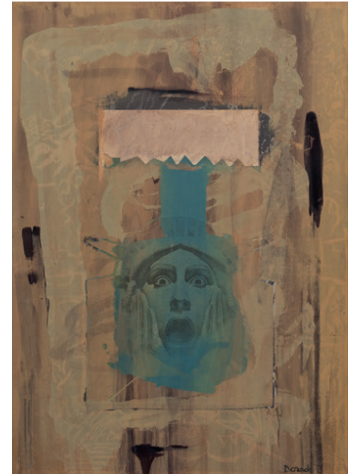
El grito, Bruselas 1994 Monotipo serigráfico sobre tablero de fibras 63,5 x 47 cm