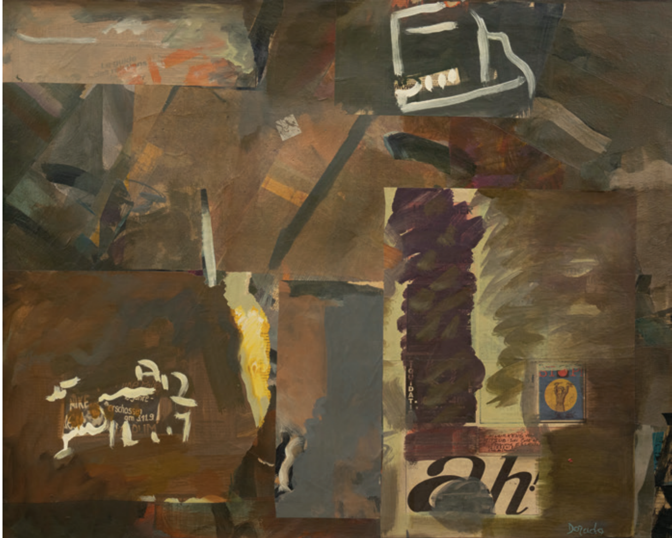
¡Asombro! Bruselas 1991 Collage y acrílico/lienzo 65 x 81 cm