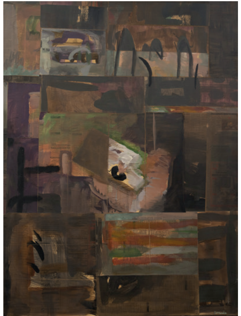
El coche , Bruselas 1992 Collage y acrílico/lienzo 130 x 97 cm