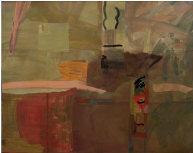
Sin título, Bruselas 1991 Collage y acrílico/lienzo 73 x 92 cm