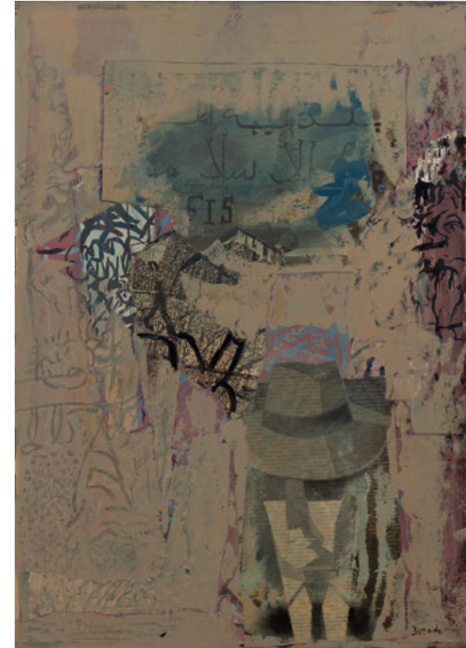
Serie negra, Bruselas 1994 Monotipo serigráfico sobre tablero de fibras 63,5 x 47 cm