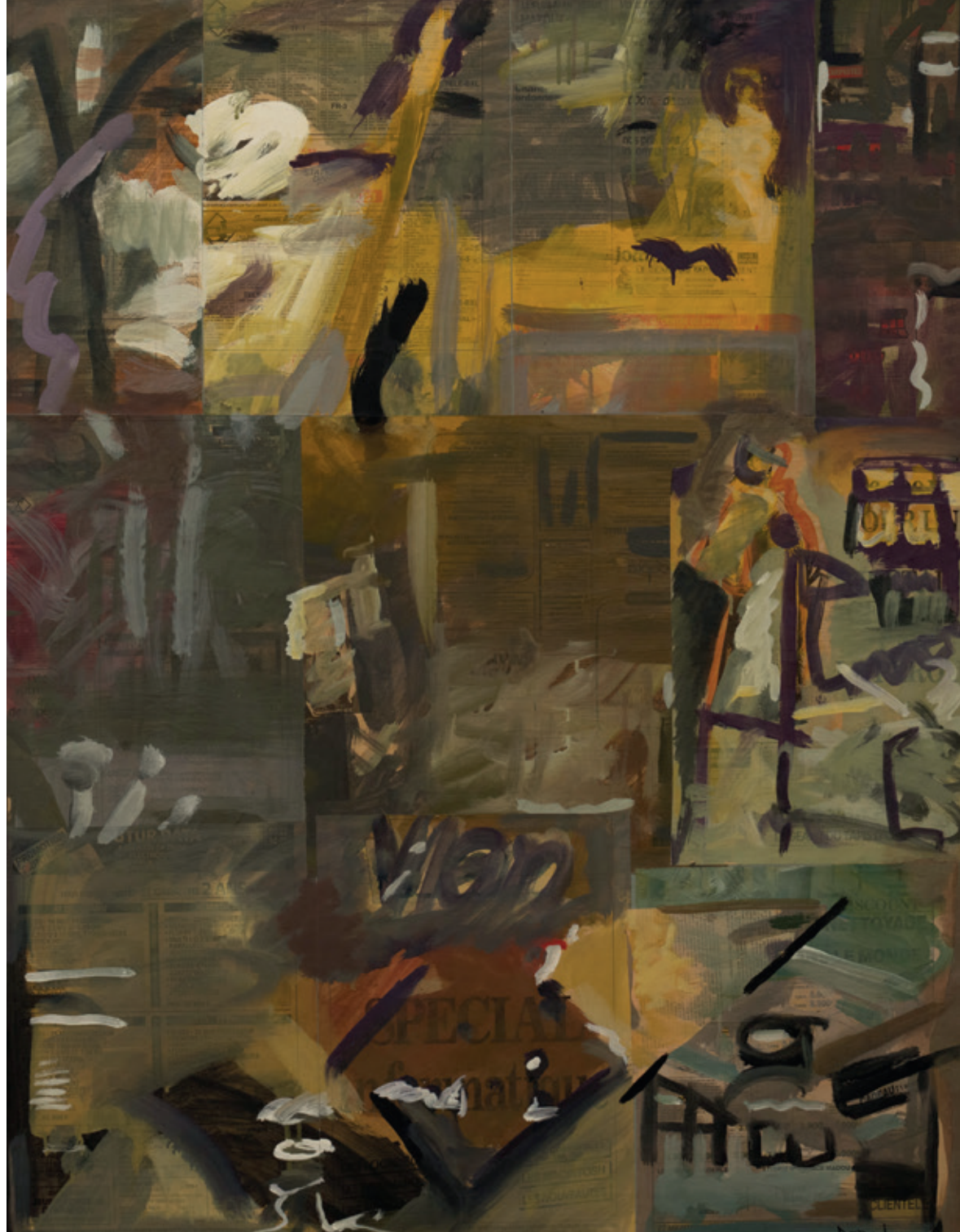
Especial VLAN Bruselas 1991 Collage y acrílico/lienzo 116 x 89 cm