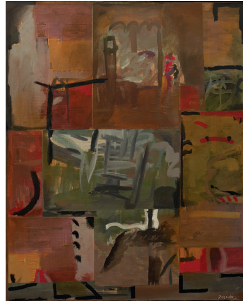
Stock à emporter , Bruselas 1991 Collage y acrílico/lienzo 100 x 81 cm