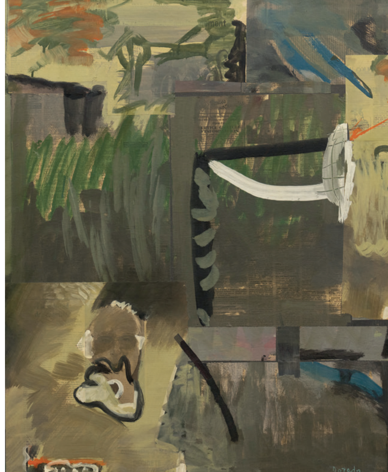
Más rebajas Bruselas 1992 Collage y acrílico/lienzo 81 x 65 cm