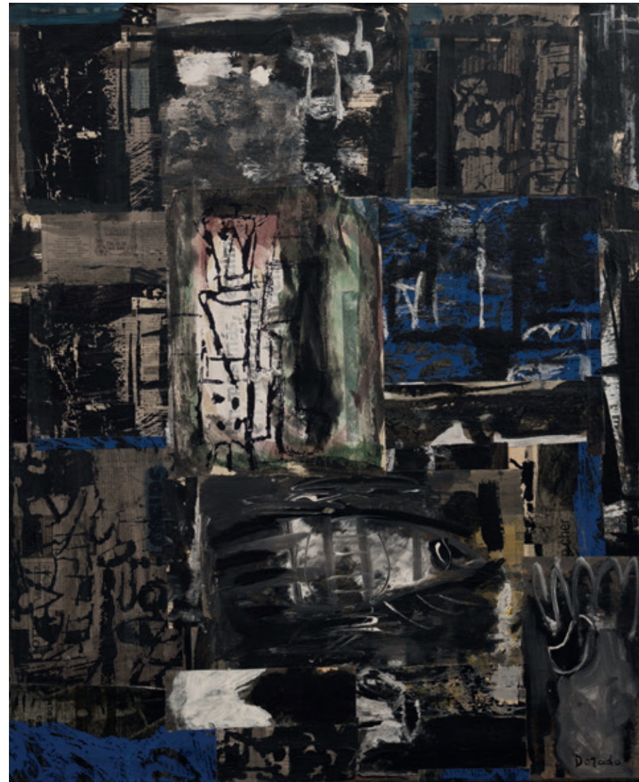
So black and blue, Bruselas 1996 Collage y acrílico/lienzo 73 x 60 cm