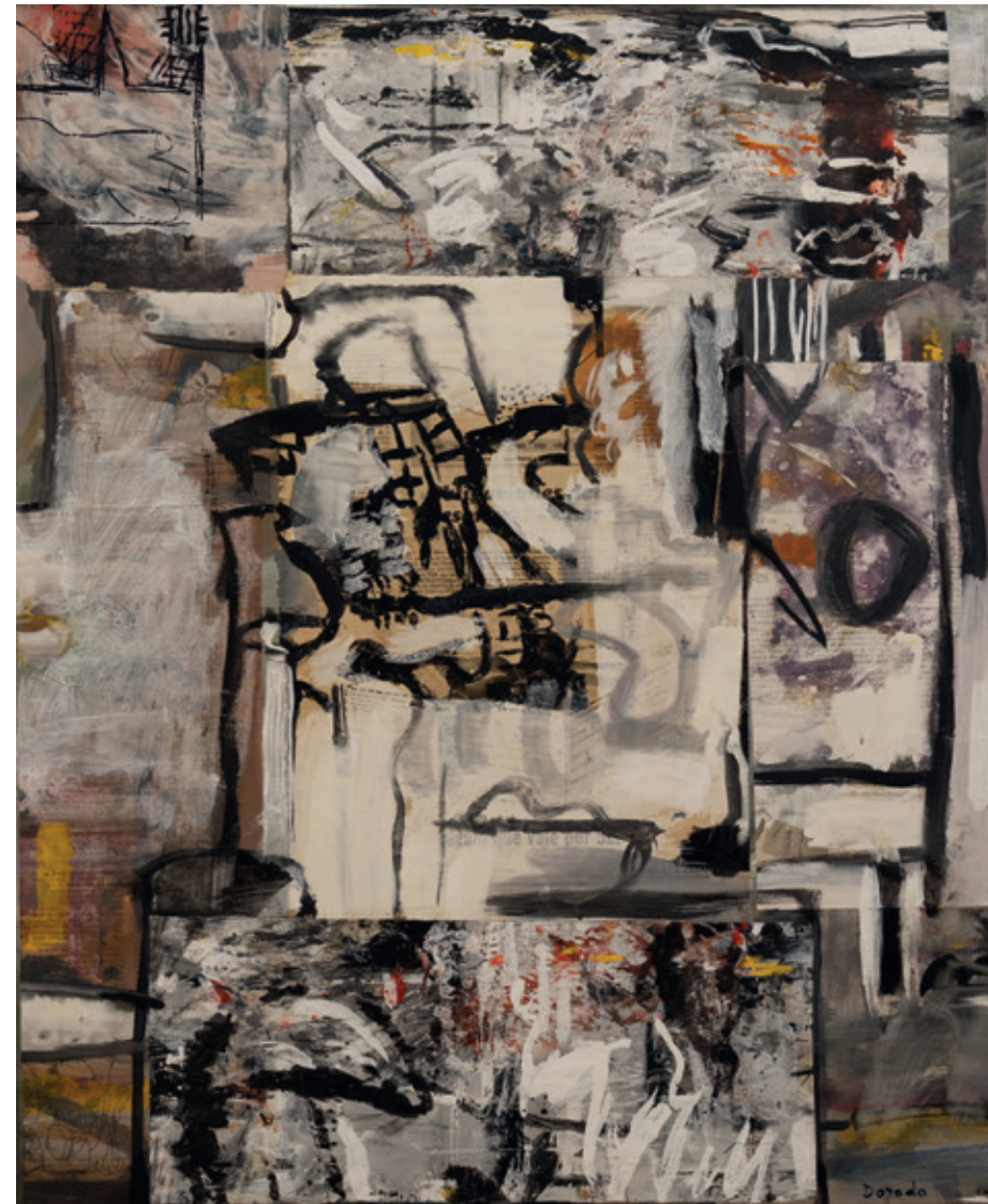
Letras en la basura, Bruselas 1996 Collage y acrílico/lienzo 73 x 60 cm