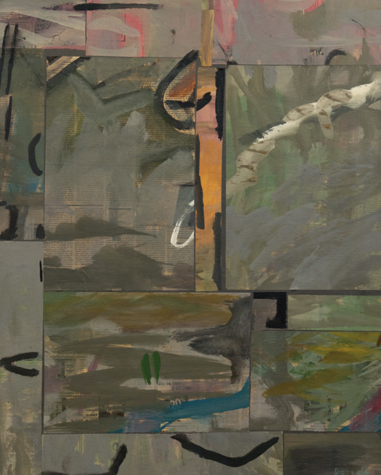
Rebajas de invierno Bruselas 1992 Collage y acrílico/lienzo 81 x 65 cm