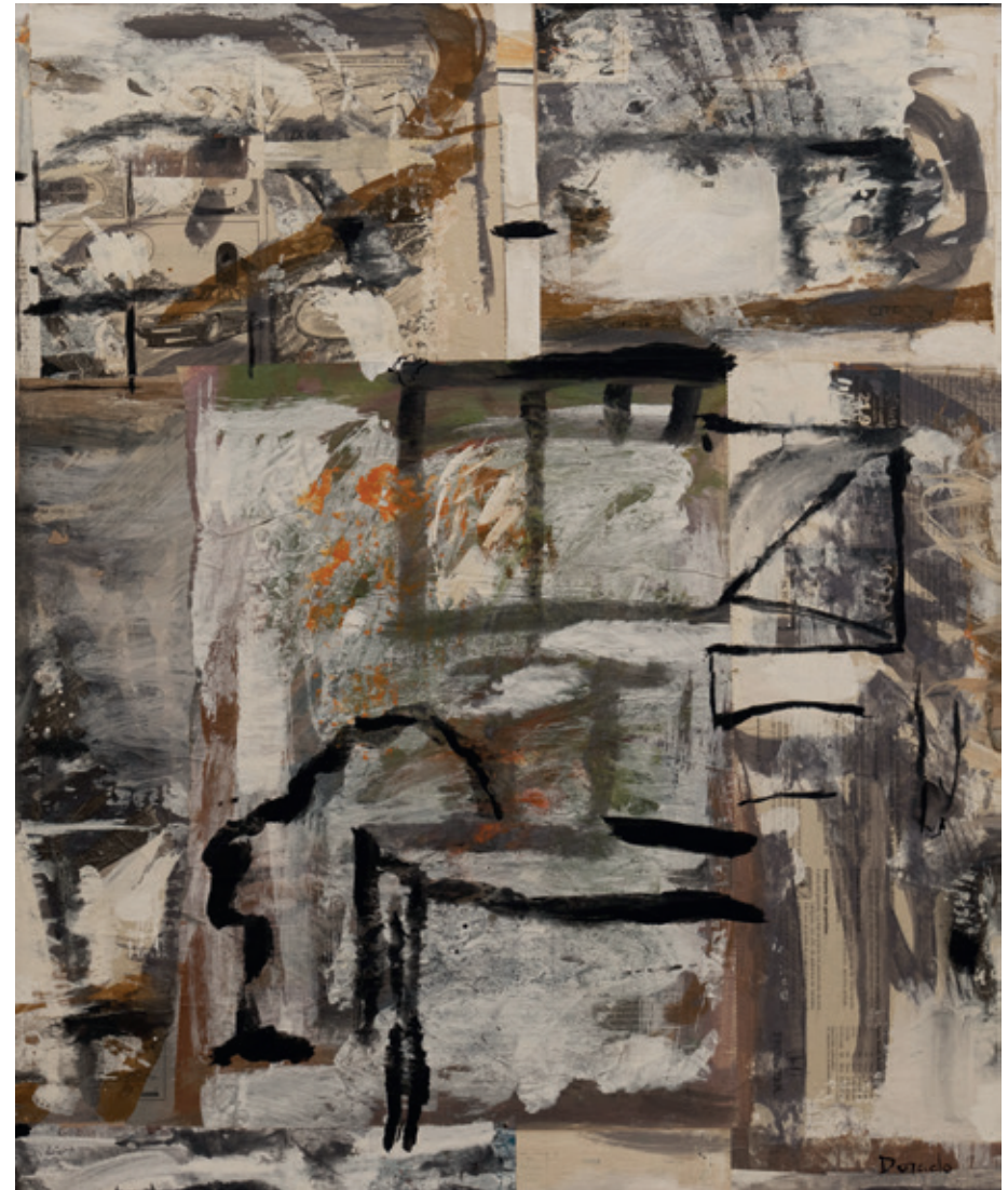
Cara y cubo, Bruselas 1996 Collage y acrílico/lienzo 65 x 54 cm