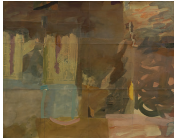
Sin título, Bruselas 1991 Collage y acrílico/lienzo 73 x 92 cm