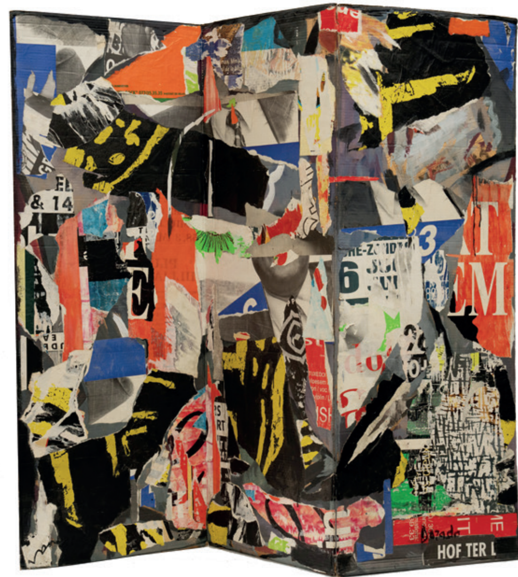
Biombo 2, Bruselas 1992 Collage/cartón plegado en 3 paneles 132 x 150 cm