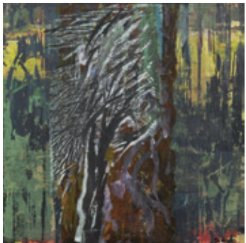
Monotipos serigráficos sobre tablero de fibras, Bruselas 1994 30 x 30 cm