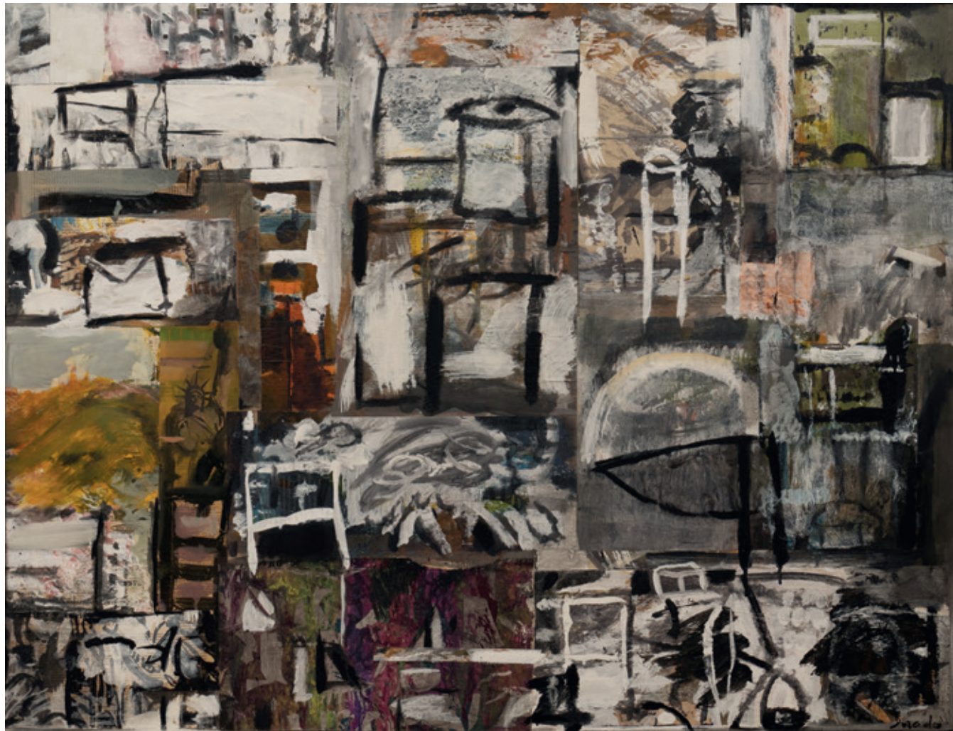
Cocina y libertad , Bruselas 1996 Collage y acrílico/lienzo 89 x 116 cm