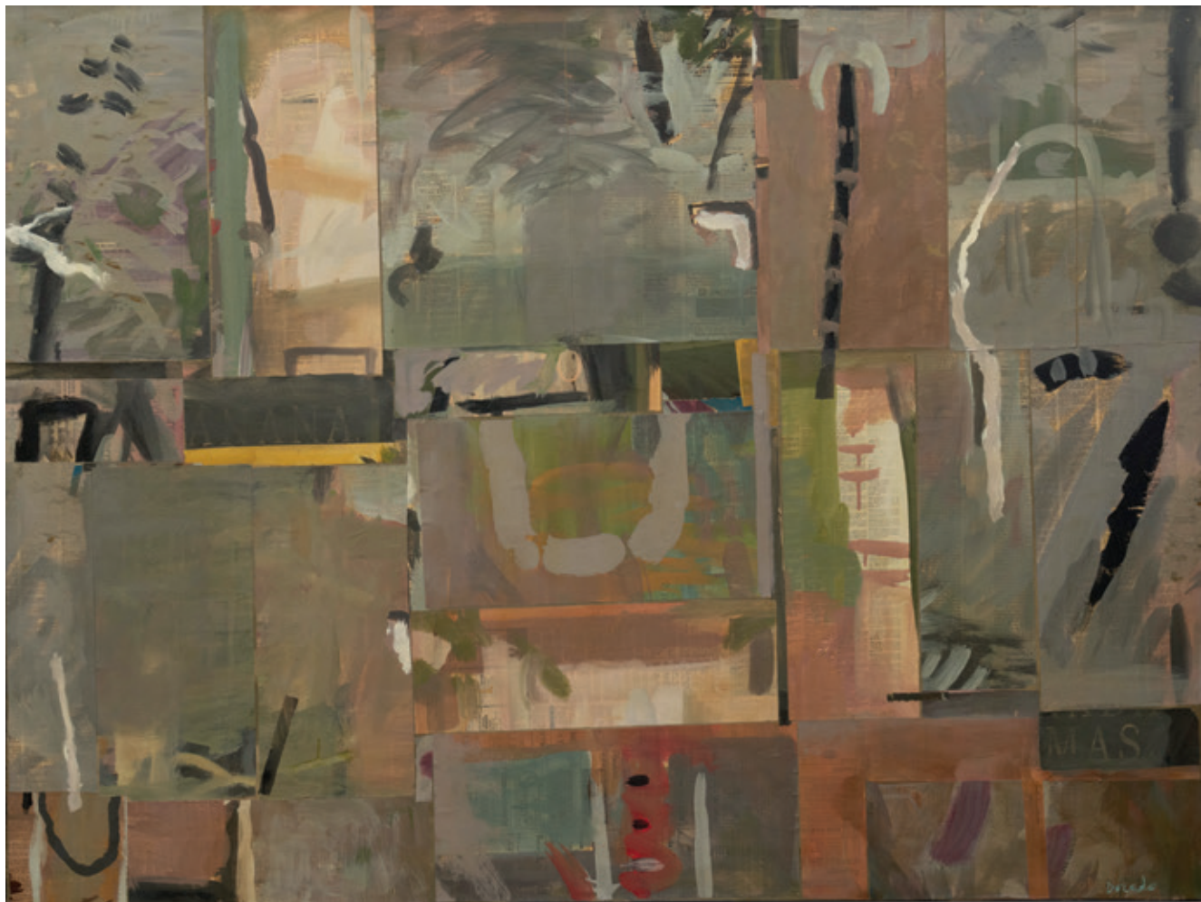
Casi verano, Bruselas 1992 Collage y acrílico/lienzo 97 x 130 cm