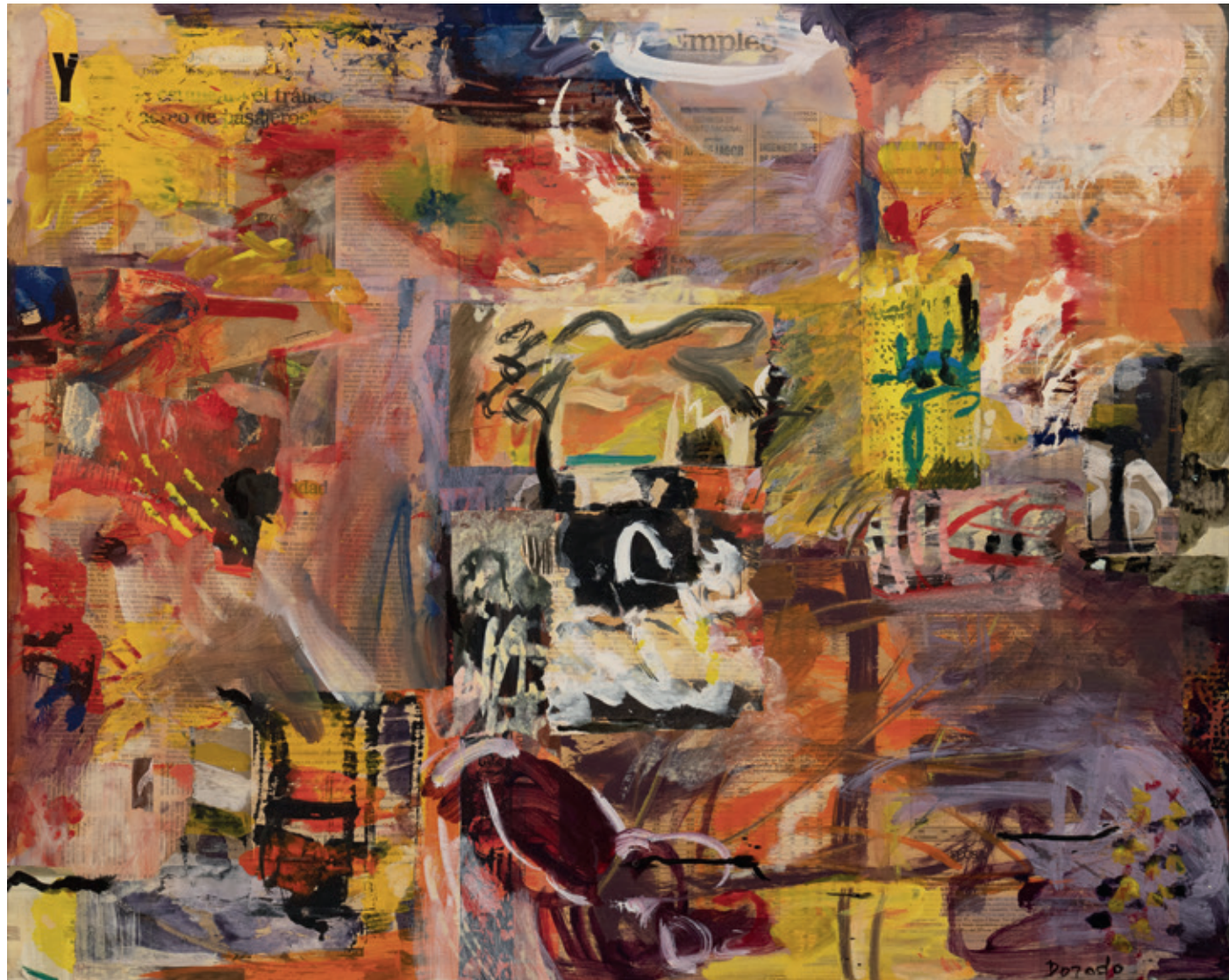
Empleo , Bruselas 1996 Collage y acrílico/lienzo 65 x 81 cm