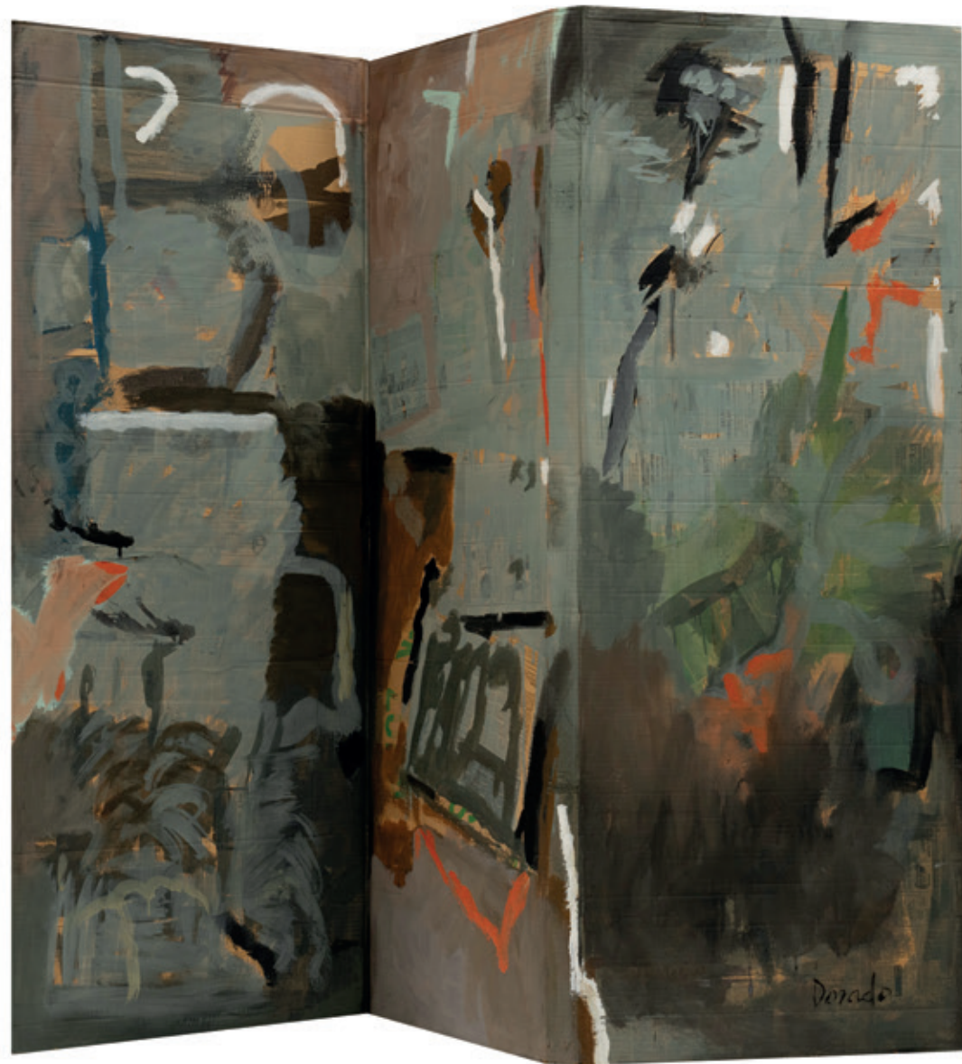
Biombo 1, Bruselas 1993 Acrílico/cartón plegado en 3 paneles 136 x 150 cm