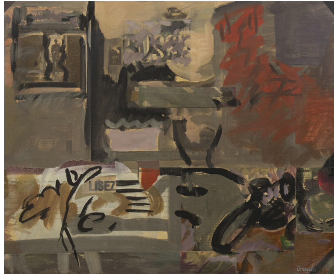
Te observan , Bruselas 1991 Collage y acrílico/lienzo 60 x 73 cm