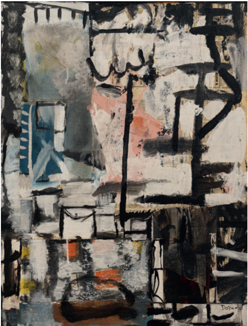
Carta , Bruselas 1996 Collage y acrílico/lienzo 65 x 54 cm