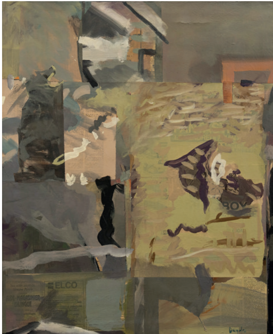
Jugando al escondite, Bruselas 1992 Collage y acrílico/lienzo 70 x 60 cm