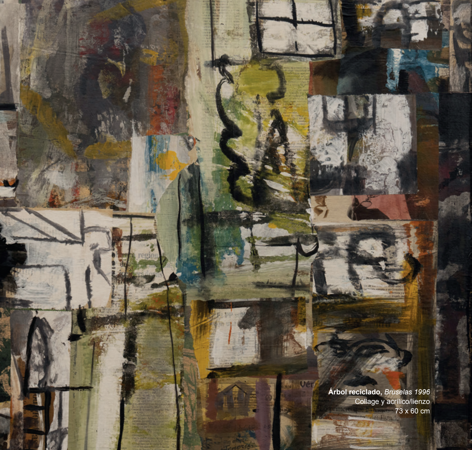
Árbol reciclado, Bruselas 1996 Collage y acrílico/lienzo 73 x 60 cm