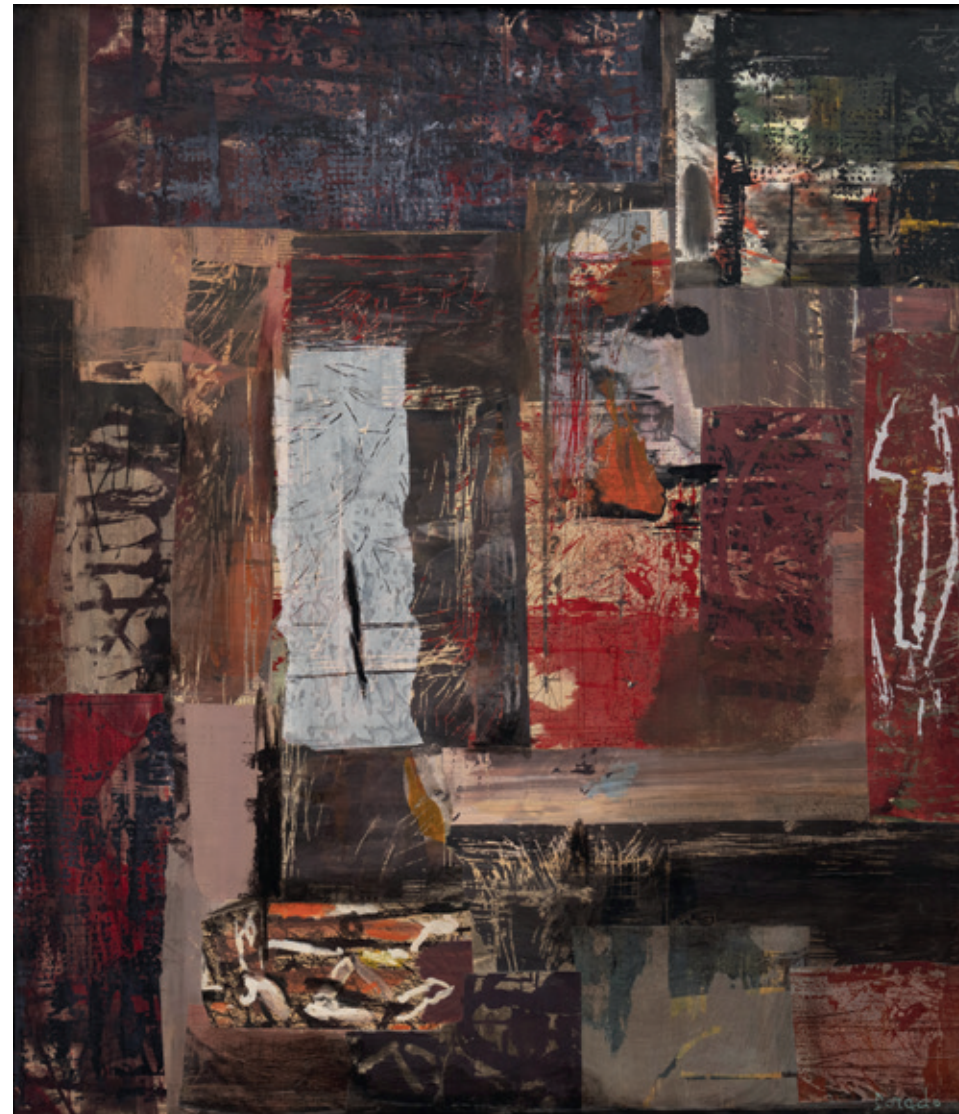
La máscara , Bruselas 1997 Collage y acrílico/lienzo 80 x 70 cm